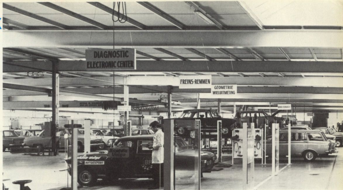
Gedeeltelijk zicht van de werkhuizen

De uiterst complete reeks technische uitrustingen, van eerste rang, maken het Centrum mogelijk alle controle-, onderhoudswerken en herstellingen uit te voeren aan een hoog technisch niveau.